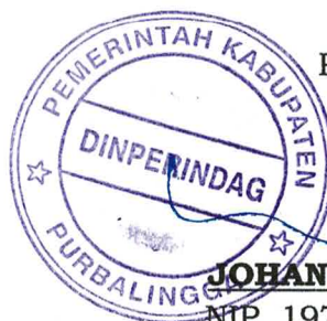
DYAH HAYUNING PRATIWI, SE, B.Econ, MM